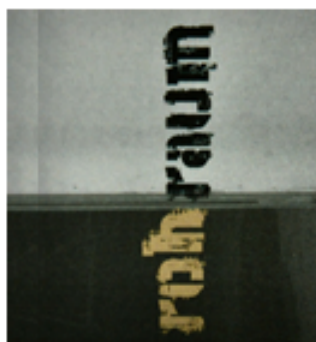
rohraum Neschwilerstrasse 19 8486 Rikon

Bis heute beschäftigt sich die Künstlerin intensiv mit Magnetbändern. Keiner weiss, was auf ihnen dank Magnetisierung gespeichert ist: Theaterkomödien, Tierfilme, Kindersendungen wie Spielhaus oder Lassie, Sex & Crime. Das Schwarz verheimlicht alles. Mit der Transformation verlieren die Bänder ihre Funktion als Datenspeicher. Das rezyklierte Werk ist ein Speicher in neuer Form, in der das Material in den Vordergrund tritt. Wir sehen etwas, was das Eigentliche verbirgt.